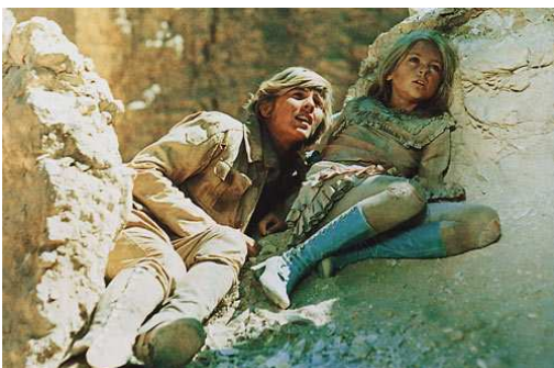
"W pustyni i w puszczy" reż. Władysław Ślesicki [1973 r.]