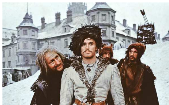
"Potop" reż. Jerzy Hoffman [1974 r.]